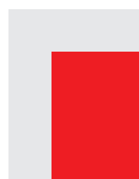
1/2 PG ISLAND 4C 117 x 184 mm + 5 mm (vivo/bleed)