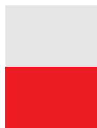
1/2 PG 4C 210 x 148 mm + 5 mm (vivo/bleed)