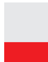
1/3 PG 4C 210 x 99 mm + 5 mm (vivo/bleed)