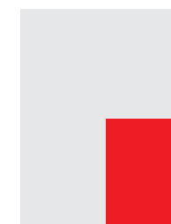
1/4 PG 4C 105 x 148 mm + 5 mm (vivo/bleed)