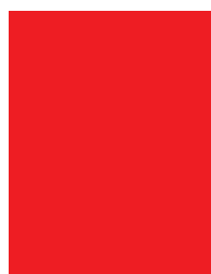
1 PG 4C 210 x 297 mm + 5 mm (vivo/bleed)