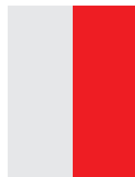
1/2 PG 4C 105 x 297 mm + 5 mm (vivo/bleed)